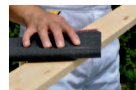
Dosky obrúsime brúsnym papierom

Prvým krokom pri natieraní plotu je impregnácia s LAZUROL IMPREGNAČNÝ ZÁKLAD S 1033. Niektorí si myslia, že je to zbytočný náter, ktorý len spomalí dobu celkového náteru, a taktiež že sú to peniaze naviac, avšak tento náter má svoje opodstatnenie. LAZUROL IMPREGNAČNÝ ZÁKLAD sa napenetruje do hĺbky dreva, kde vnesie fungicídne prostriedky, ktoré zamedzia vplyvu drevoškazného hmyzu, hubám. Zároveň zabránime nasiakavosti dreveného podkladu, vďaka ktorému docielime vyvážené odtiene pri dekoratívnych náteroch. Dosky po napustení necháme 24 hodín vysušiť, následne môžeme, avšak nemusíme povrch obrúsiť brúsnym papierom. To záleží od typu natieraného predmetu – napr. dlhé vonkajšie ploty brúsiť nemusíme, ale madlo zábradlia je vhodný prebrúsiť. Brúsením drevo nepoškodíme, len odstránime prípadne chĺpky dreva.