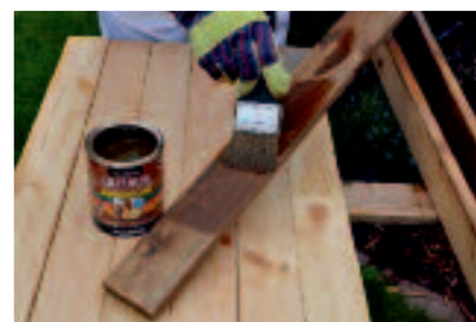
LAZUROL CLASSIC nanášame v 2-3 vrstvách, vždy s časovým odstupom 24 hodín