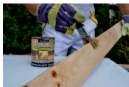
Obrúsené dosky najskôr naimpregnujeme