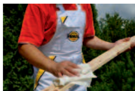
Po obrúsení dosky očistíme utierkou

Prvým krokom pri natieraní plotu je impregnácia s LAZUROL IMPREGNAČNÝ ZÁKLAD S 1033. Niektorí si myslia, že je to zbytočný náter, ktorý len spomalí dobu celkového náteru, a taktiež že sú to peniaze naviac, avšak tento náter má svoje opodstatnenie. LAZUROL IMPREGNAČNÝ ZÁKLAD sa napenetruje do hĺbky dreva, kde vnesie fungicídne prostriedky, ktoré zamedzia vplyvu drevoškazného hmyzu, hubám. Zároveň zabránime nasiakavosti dreveného podkladu, vďaka ktorému docielime vyvážené odtiene pri dekoratívnych náteroch. Dosky po napustení necháme 24 hodín vysušiť, následne môžeme, avšak nemusíme povrch obrúsiť brúsnym papierom. To záleží od typu natieraného predmetu – napr. dlhé vonkajšie ploty brúsiť nemusíme, ale madlo zábradlia je vhodný prebrúsiť. Brúsením drevo nepoškodíme, len odstránime prípadne chĺpky dreva.