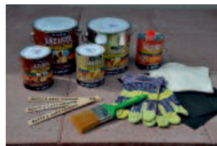
Potrebné produkty a pracovné pomôcky

Je známe, že akýkoľvek náter drží dobre len vtedy, ak dobre drží aj základ. Na takto pripravený podklad už môžeme následne aplikovať ďalšie vrstvy farby. Ako najdôležitejšie je dobre vysušené drevo. Pokiaľ budeme natierať na zle vysušený drevený podklad, potom akákoľvek najlepšia a najdrahšia farba nebude držať a odlúpe sa. Najistejšie je si zmerať vysušenie dreva, ak tak nevieme urobiť, tak potom náter aplikujeme na suché drevo v suchom počasí.