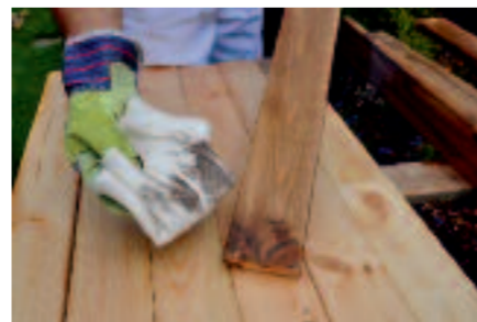
Po 15 minútach zotrieme nevsiaknutú lazúru