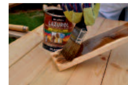
Nanášame štetcom v dvoch vrstvách v časovom intervale 24 hodín