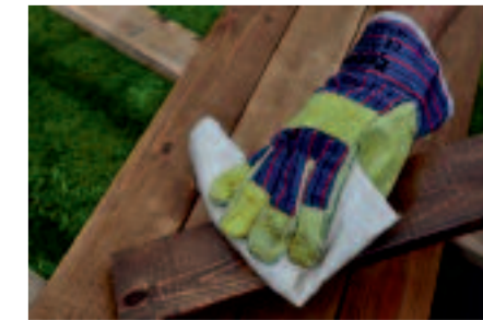
Nevsiaknutú lazúru zotrieme po 15 minútach po nanesení každej vrstvy

Pre rovnomeré zvýraznenie kresby dreva je vhodné nevsiaknutý lak po 10 až 15 minútach od nanesenia zotrieť pomocou suchého štetca alebo utierky. Potreba zotretia závisí od typu natieraného predmetu. Ak natierame dlhé ploty, stieranie utierkou vymecháme, namočíme iba konce štetin a lazúry sa snažíme dlhými ťahmi poriadne rozotrieť, aby nám nestiekla ale rovnomerne sa vsakovala.